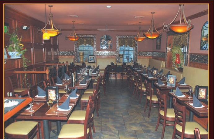
Amplio y acogedor salón comedor.