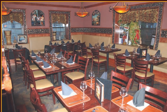
Confortable comedor con la mejor atención.