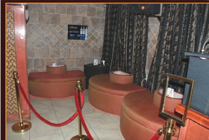
Nuestro salón VIP para su disfrute en privacidad.

El lugar ideal para sus fiestas navideñas, corporativas, profesionales y familiares