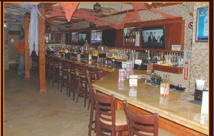
Elegante Lounge con pista de Baile.

525 Bayway Avenue, Elizabeth, NJ - (908) 469-1741